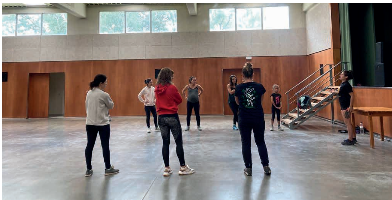
Fotografia del taller d'autodefensa.

Tota la jornada va anar acompanyada de debats i moments de debat per part de les assistents on es compartien situacions viscudes, preguntes, dubtes o reflexions entorn de l'autodefensa, generant un espai de confiança i reflexió.