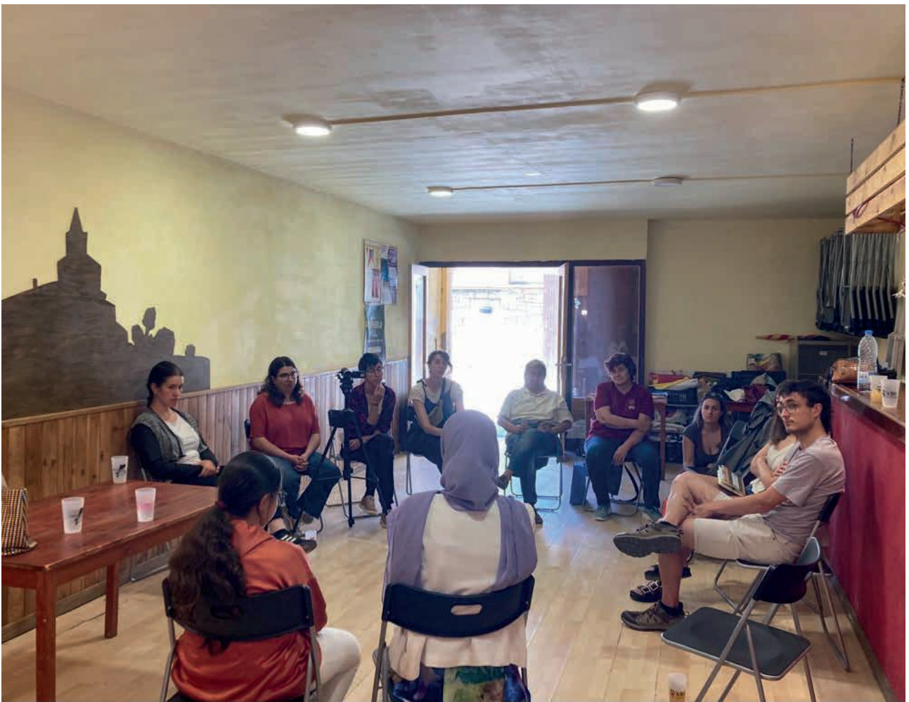
Fotografia de la xerrada amb el col·lectiu Micaela