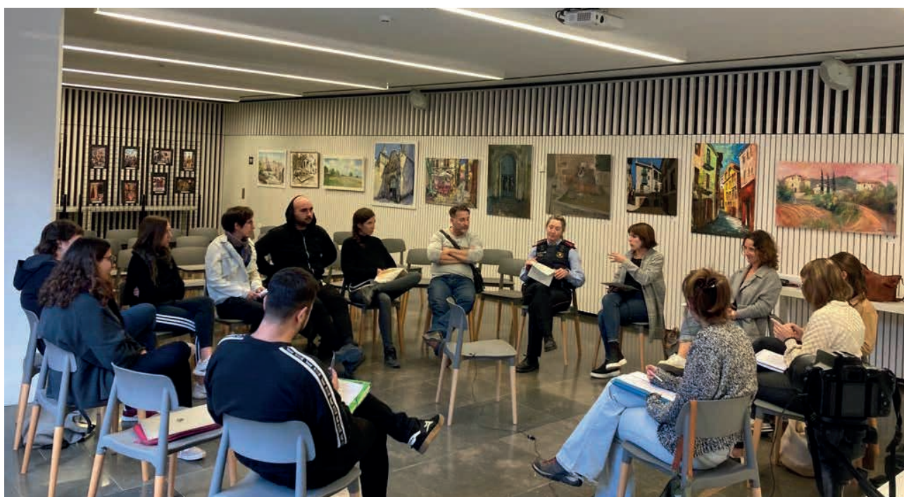
Fotografia de la taula “Violències masclistes en l’oci nocturn. Més enllà dels Punts Liles”

La Falguera Ràdio és un programa de ràdio i pòdcast de la Catalunya Central: fan difusió de l’actualitat amb les ulleres violetes posades i són un altaveu dels relats positius dels feminismes. S’emmarquen en