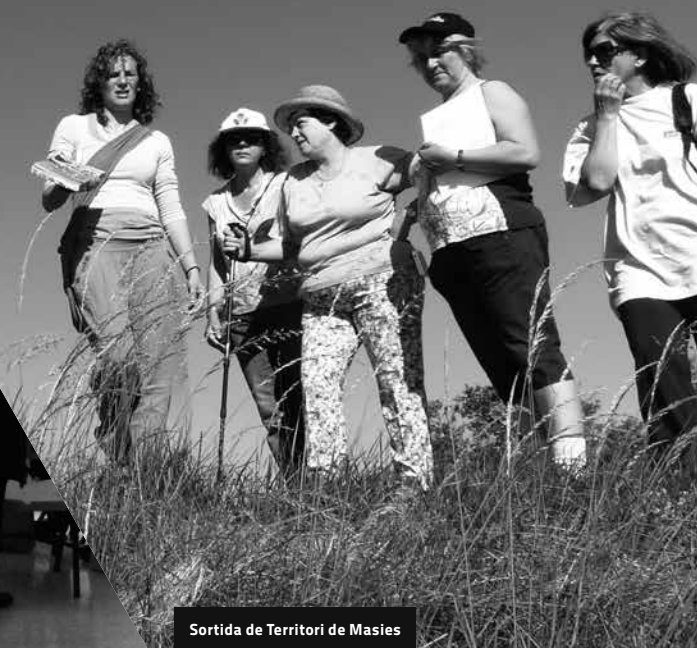
Sortida de Territori de Masies