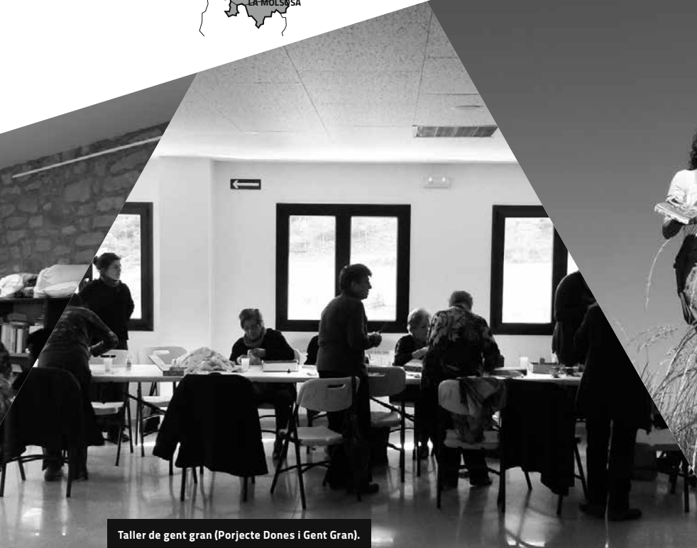
Taller de gent gran (Projecte Dones i Gent Gran).

► ACTUA és el camí per a fer realitat les propostes de millora pel Solsonès que recollia el PAI del Solsonès (Pla d'Acció Integral).